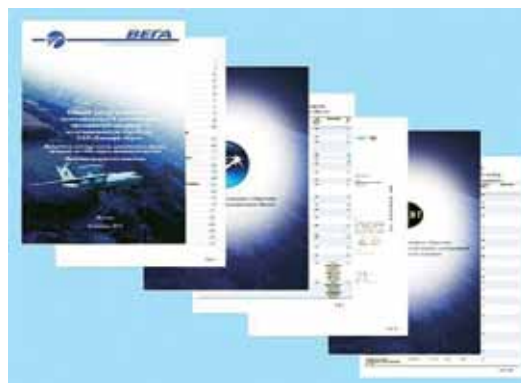
Рис. 4. Оформление бумажного реестра РИД

с АЕРИД, элементами управления интеллектуальной собственностью, вопросам оформления заявок на регистрацию охраноспособных РИД. К обучению привлечены партнеры – организации, специализирующиеся на вопросах управления интеллектуальной собственностью.