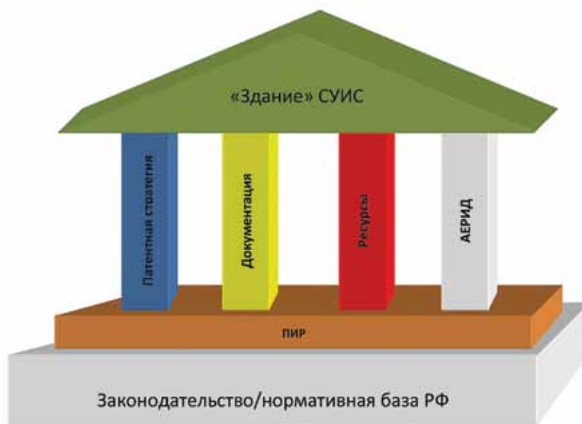
Рис. 5. «Здание» СУИС

обозначенных Президентом и Правительством Российской Федерации по построению инновационной экономики.