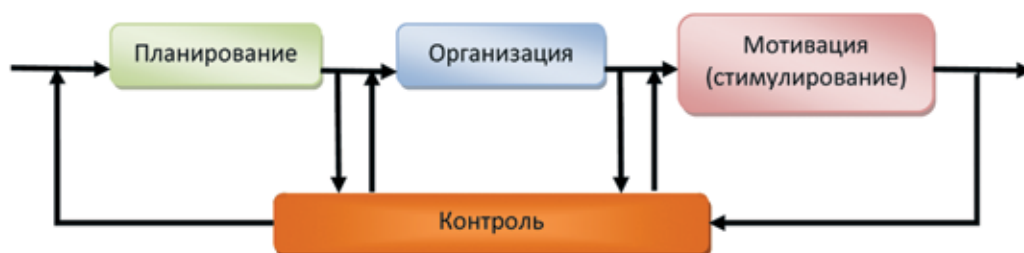
Рис. 2. Основные процессы управления интеллектуальной собственностью и их взаимосвязь